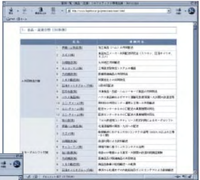
▲省資源事例集ホームページ

http://www.logistics.or.jp/green/case/case1.html