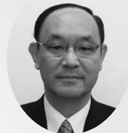
ロジスティクス強調月間2012 推進委員会 ロジスティクス全国大会2012 実行委員会

全国のロジスティクス関係者の方々が一堂に会し、充実した発表と活発な交流を行うことで、関係者相互の交流がさらに深まり、これからのロジスティクスのあり方を導き出す機会になることと確信しております。是非、このような場を積極的にご活用いただき、多数の皆様が参加されることを心からお待ち申し上げております。